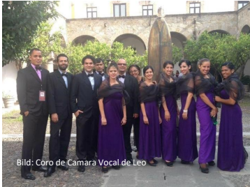
Bild: Coro de Camara Vocal de Leo

Der Verein der Freunde und Förderer der Liebfrauenkirche lädt ein zu einem Konzert am Samstag, 11. Mai 2024 um 19.00 Uhr in der Liebfrauenkirche