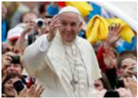
Das ist unser Papst Franziskus.