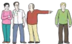
Die Menschen hatten viel Streit. Viele wollten besser sein als andere Menschen.