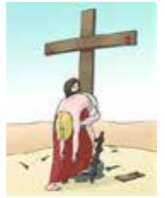
Jesus ist am Kreuz gestorben.